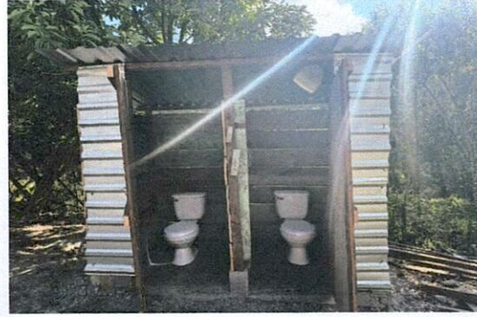
Foto 2: Mejoramiento de área de servicio sanitario con fosa séptica.